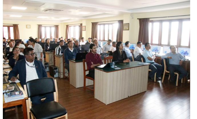
ख्वप नगरपालिकापाखं न्ह्याकगु नेन्हूया AI तालिम न्ह्यात ।