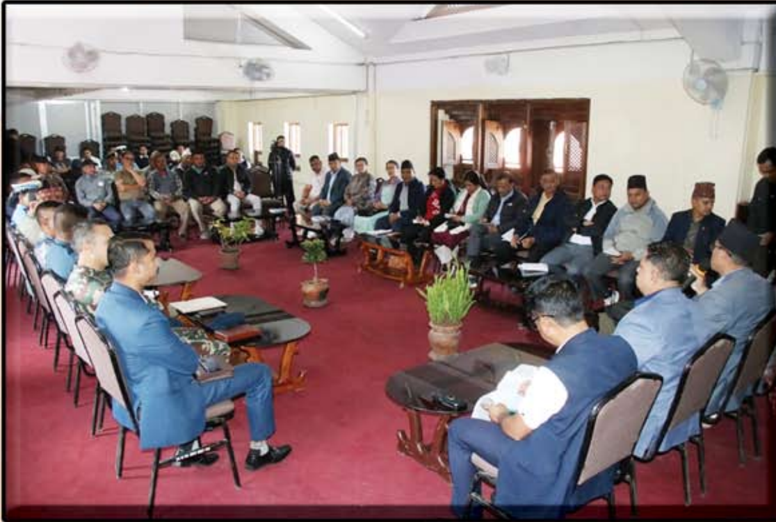
लोकं हवागु ब्खपया बिस्का जात्रा तःजिक हानयता ब्वापु ढःपुं नपां बैठक २०८२ चैत्र ११