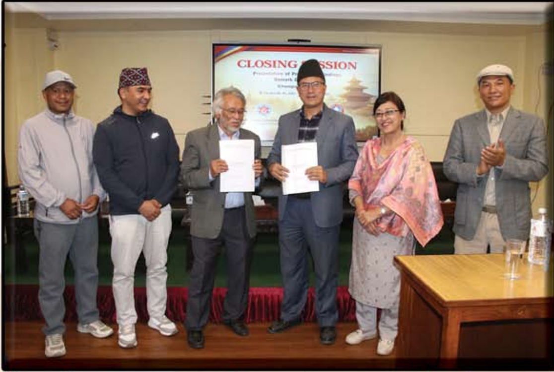
विश्व विद्यालय अनुदान आयोग पाखं जूगु भमकक्षी परीक्षण पुचः या प्रारम्भिक अनुगमन क्वचाल २०८२ चैत्र १०