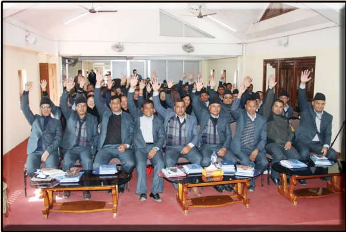
रूषप नगरपालिकाया हिं न्हयकगु नगररूभा न्हयात (२०८१ पुस २६ गते)