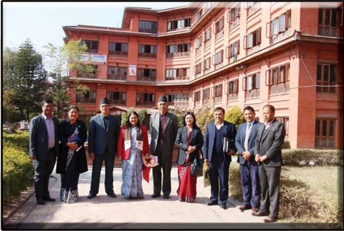
शिक्षा, विज्ञान ँ प्रविधि मन्त्री भट्टराई रूषप नगरपालिकाय (२०८१ पुस १६ गते)