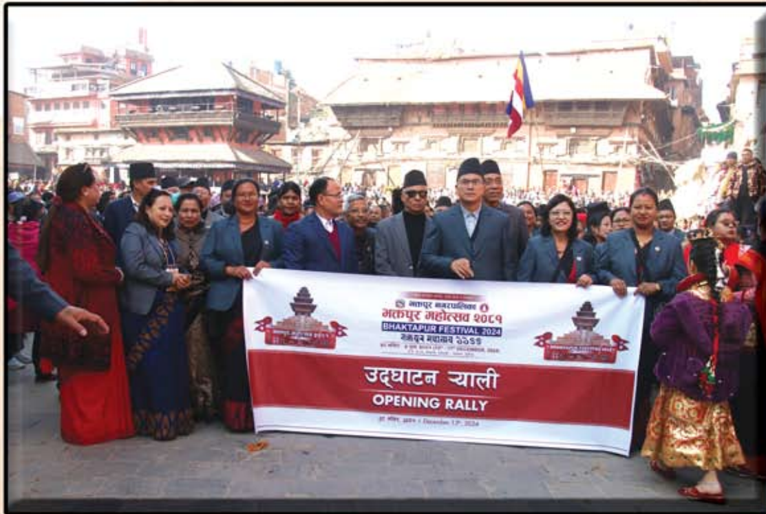
बखप महोत्सव न्ह्याकयता जूगु ठलेज्या च्याली (२०८१ मंसिर २८ गते)