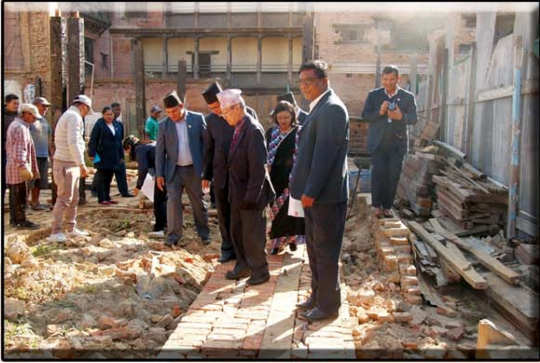
बखप नगरपालिका ढाडः च्यांगु धी धी सम्पढात बख भःले नायो भाजु बिजुकुछै जु (२०८१ मंसिर १८ गते)