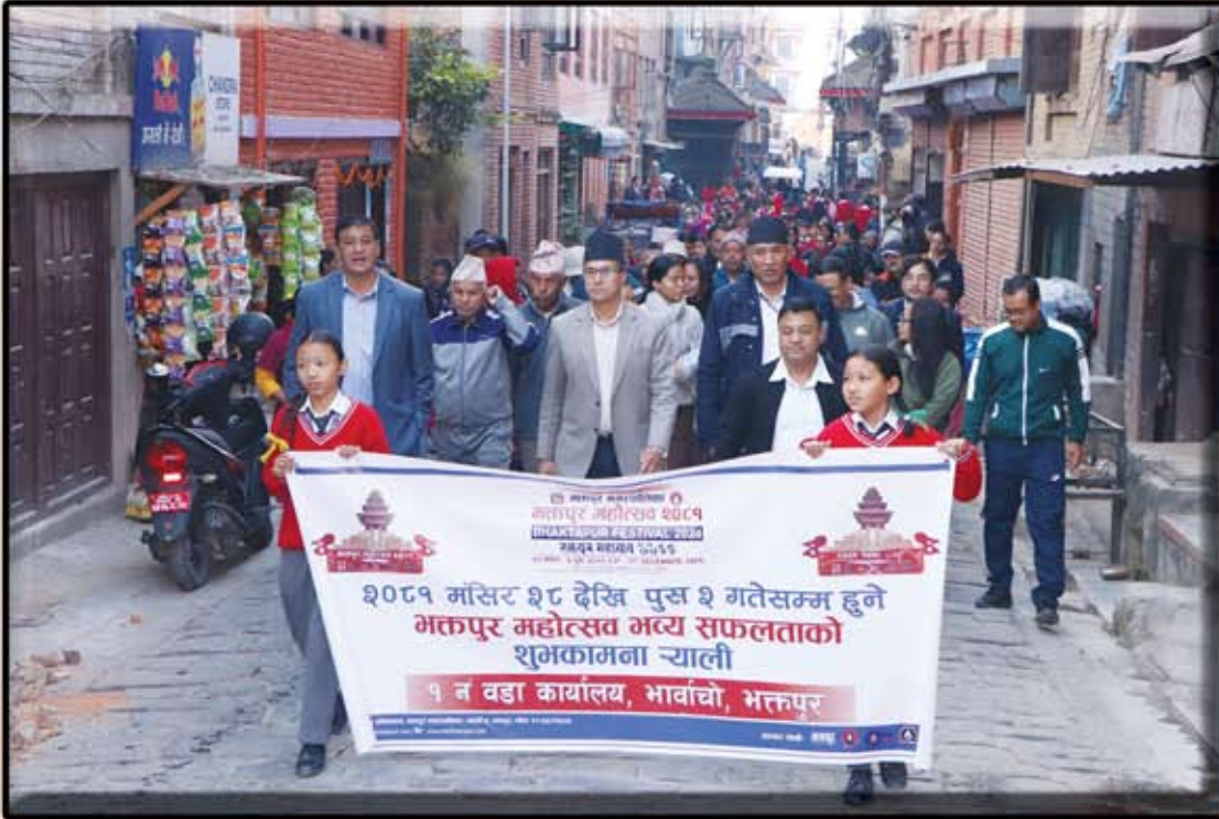
ब्खप महोत्सवया प्रचारार्थ १ नं. षडाभं भिंतुना च्याली (२०८१ मंसिर ५ गते)