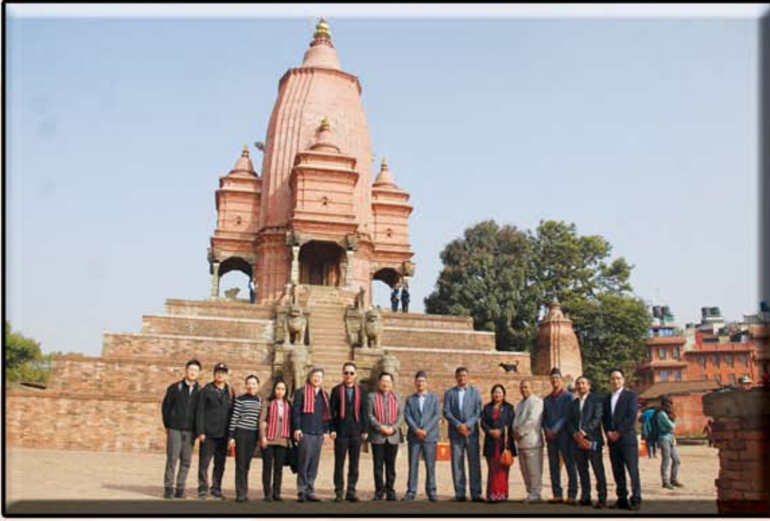
प्रवासं भ्रुःपुं चिनियाँ महाभंघया प्रतिनिधि पुचः ब्खपय (२०८१ कार्तिक २९ गते)