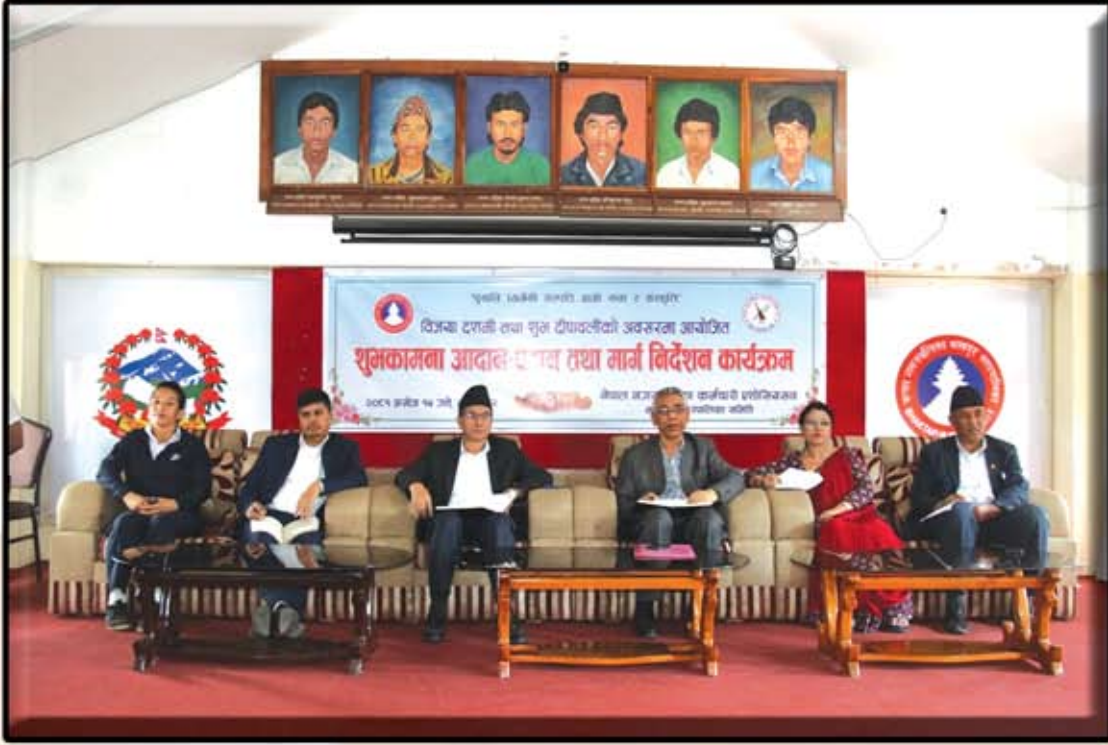
बख्रप नगरपालिकाय मोहनीया भिन्तुना कालखिल ज्या इवः (२०८१ असोज १५ गते)