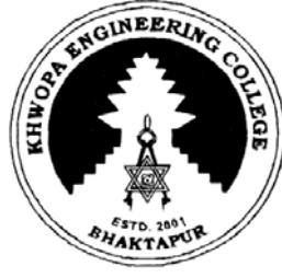
कलेज छाप (अंग्रेजी)

यो विनियमको नियम ४ अनुसार कलेजको देहाय बमोजिमको कलेज छाप हुनेछ :